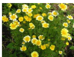
放置していればきれいな花が咲きます

春菊・・・100g、ネギ・・・1/2本、ニンジン・・・1/2本、桜エビ・・・10g、 ポン酢・コチュジャン・・・適量、ゴマ油・・・大さじ2 卵・・・1個、薄力粉 or 米粉・・・100g、水・・・50cc、塩・コショウ・・・少々