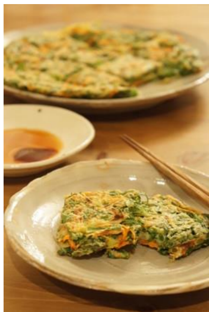
●●● 春菊のチヂミ ●●●