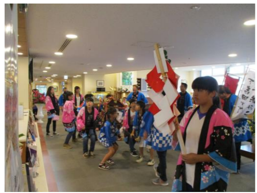
子供神輿も元気一杯です

十月になると各地で秋祭りが行われますが、善通寺市では古くから獅子舞が盛んで、今年も多くの獅子組が当院に來られました。子供たちが太鼓や鐘で音を奏でると、それに合わせて獅子が舞い、見ていた患者様やスタッフを楽しませてくれました。